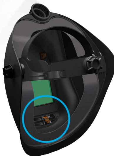
Ausblasöffnung im Mund-Nasenbereich